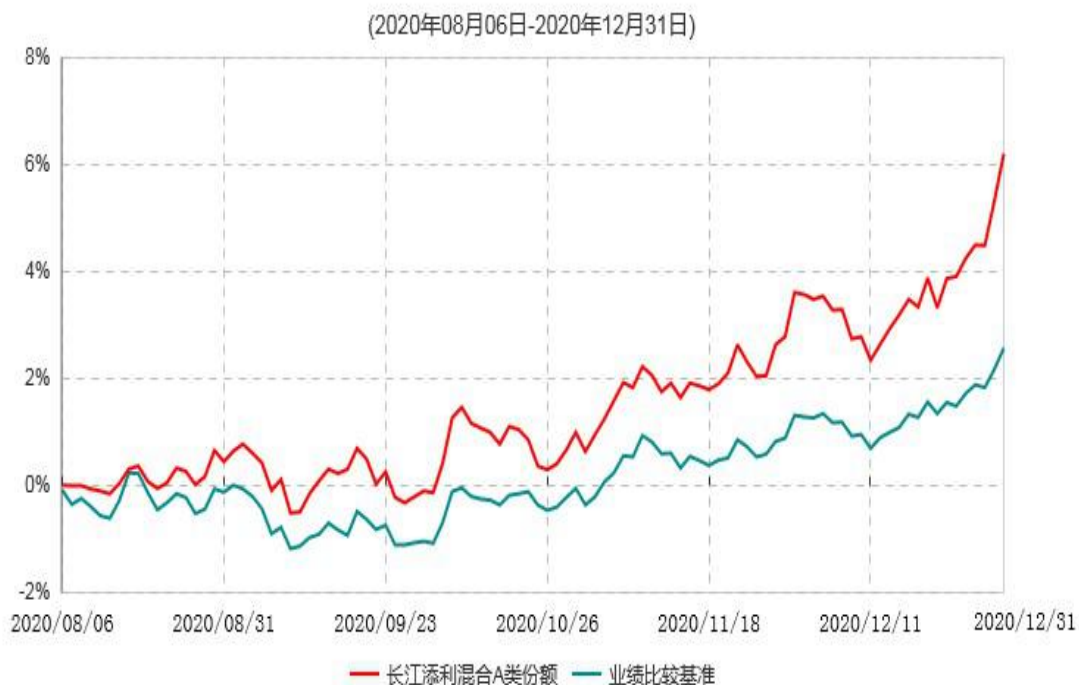
长江添利混合A类份额累计净值增长率与业绩比较基准收益率历史走势对比图