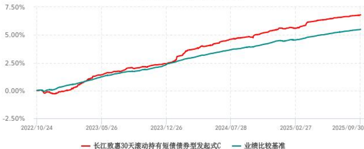
长江致惠30天滚动持有短债债券型发起式C累计净值增长率与业绩比较基准收益率历史走势对比图 (2022年10月24日-2025年09月30日)

注：本基金 C 类份额“自基金合同生效以来”的报告期为 2022 年 10 月 24 日至 2025 年 09 月 30 日。