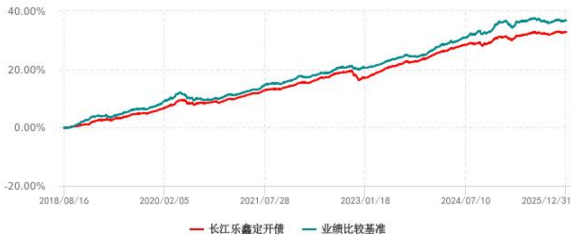
长江乐鑫纯债定期开放债券型发起式证券投资基金累计净值增长率与业绩比较基准收益率历史走势对比图 (2018年08月16日-2025年12月31日)