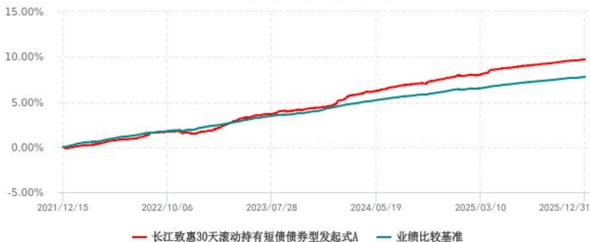
长江致惠30天滚动持有短债债券型发起式A累计净值增长率与业绩比较基准收益率历史走势对比图 (2021年12月15日-2025年12月31日)

注：本基金 A 类份额“自基金合同生效以来”的报告期为 2021 年 12 月 15 日至 2025 年 12 月 31 日。